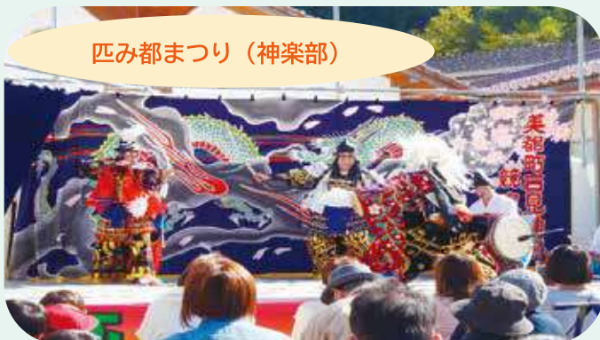
匹み都まつり (神楽部)

本校の神楽部は、益田市周辺で開催される様々な地域応援イベントに出演し、地域おこしに一役買っています。昨年11月には、「匹み都(ひきみと)祭り」に出演。圧巻の演技を披露し祭りを盛り上げました。