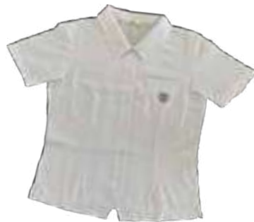
half sleeve shirt (summer)