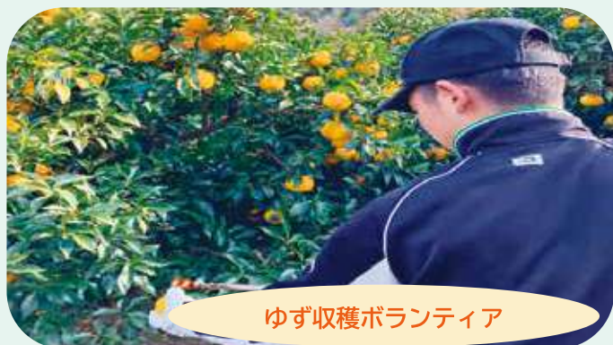
ゆず収穫ボランティア

農家の高齢化が進み収穫時に人手が不足している美都のゆず農家のお手伝いとして、本校の生徒たちが「収穫ボランティア」を2年前から行っています。県外出身の生徒にとって、益田市の魅力を知る絶好の機会にもなっています。