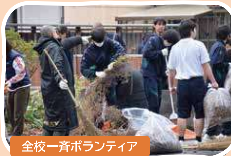
全校一斉ボランティア