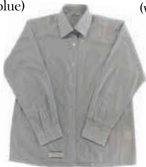
cutter shirt (winter)