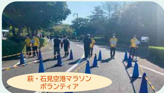
萩・石見空港マラソン ボランティア

毎年10月に開催される萩・石見空港マラソンに「サポートスタッフ」として多くの生徒が参加しています。また、吹奏楽部はステージで演奏し、大会を大いに盛り上げています。