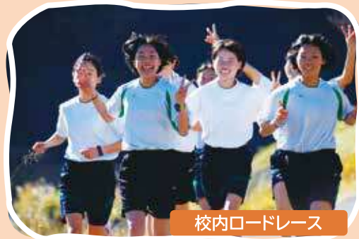
校内ロードレース