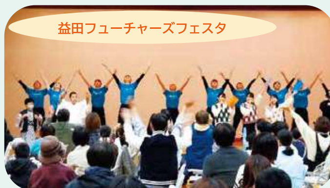
益田フューチャーズフェスタ

益田市の未来を担う若者が多数参加して開催された「益田フューチャーズフェスタ」にダンス部と神楽部が出演しました。人形劇や大道芸、落語等など、益田市内で活躍されている多くの方々と交流を深めることもでき、有意義なイベントでした。