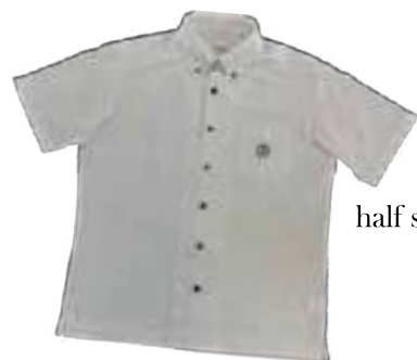
half sleeve shirt (summer)